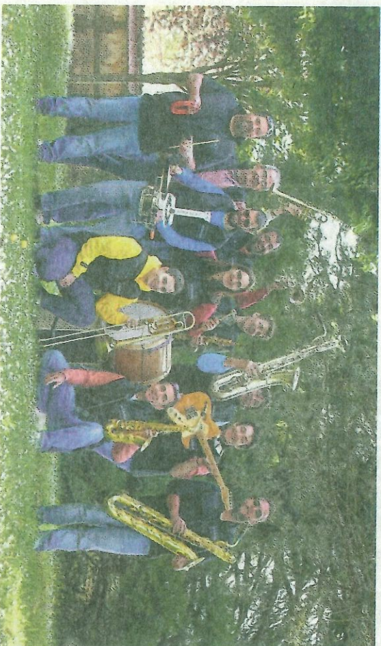
Les Z'Arts d'Eure seront à Mesnil-en-Ouche pour la fête de la musique

Comme tous les ans depuis quelques années, l'association Mesnil-en-Ouche et Pays d'Ouche en Fêtes organise un concert gratuit à l'occasion de la fête de la musique dans la commune déléguée d'Epinay. Cette année, il aura lieu le vendredi 14 juin 2024 à 18 h 30.