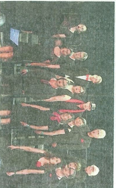
Les voix de Normandie regroupent des chanteurs de tout âge et de tout niveau.

■ Pour tous renseignements : 02 32 44 40 50