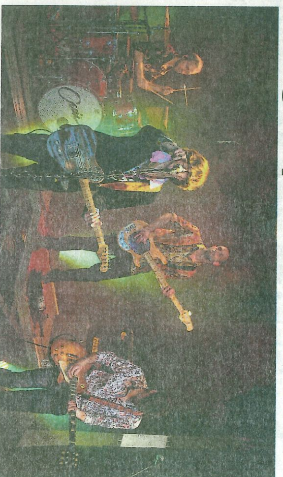
Ouil jouera pour la première fois à Mesnil-en-Ouche.

Ouil continue à composer, faisant tout « à l'oreille », car il est malvoyant, et en 2020, durant le confinement, il se produit seul dans sa chambre, en concert, en live sur les réseaux sociaux tous les dimanches : il y joue des reprises, mais aussi ses propres compositions. Par la suite, il joue dans des bars et sur des petites scènes de la région dieppoise.