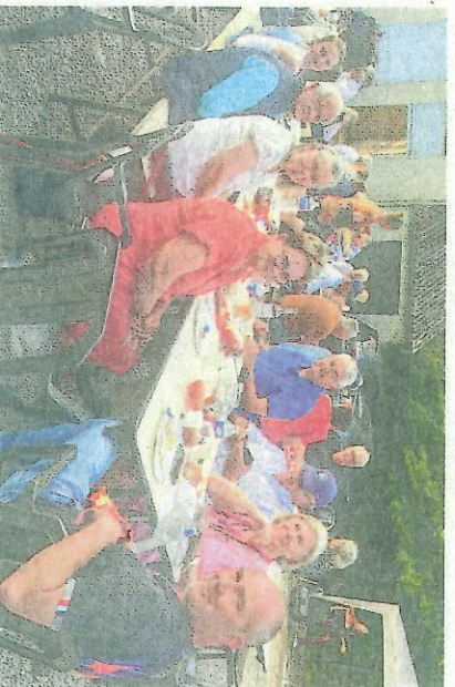
Des habitants en attente de la paella !

Le comité des fêtes de Gouttières organise la fête de la musique le vendredi 21 juin à partir de 19 h. Elle sera animée par le Duo Osani, groupe local de variétés françaises, jazz et soul, avec un repas Paella.