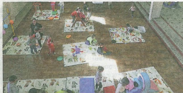
De nombreux ateliers attendaient les enfants.