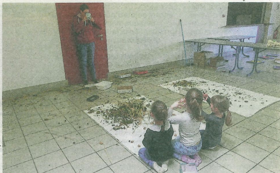
Land'art ou l'art avec la nature, trois artistes attendent d'être prises en photo afin d'immortaliser leur œuvre et de la montrer à leurs parents.

Lors de la journée, les enfants ont pu profiter largement