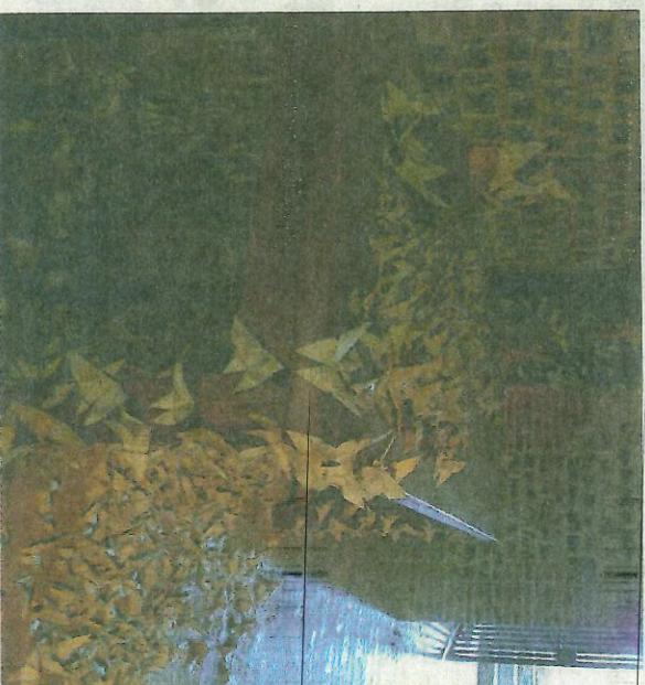
Le retour vers la lumière de la conscience.