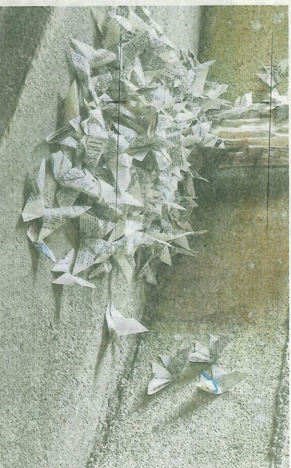
Ces petits origamis envahissent tout.

L'artiste LNJ propose une installation intrigante et originale, du vendredi 6 au dimanche 8 septembre, à la chapelle de la famille de Maistre de Beaumesnil (celle située dans l'institut médicoéducatif).