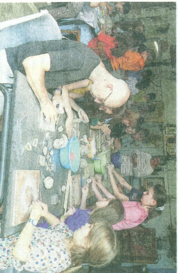
Tous sont attentifs à ce qu'ils font.

Dans le cadre de l'événement le Sentier d'Art dans le centre-bourg de Beaumesnil, plusieurs activités gratuites sont organisées dans le village, comme cet atelier poterie/modelage pour petits et grands.