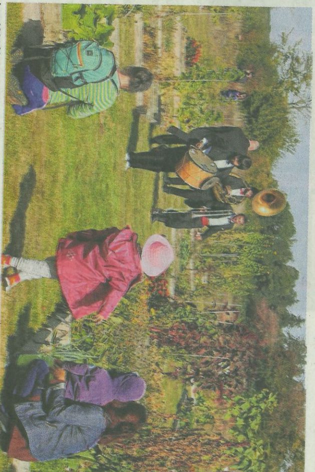
Les 1001 légumes son de retour avec leur festival les 25 et 26 septembre au potager de Beaumesnil.

■ Pratique : Festival des 1 001 légumes à Beaumesnil, samedi 25 et dimanche 26 septembre. Tarifs 4 € (6 à 12 ans 3 €, gratuit jusqu'à 6 ans). Plus d'informations sur le site www.1001legumes.fr ou par téléphone au 06 84 67 93 21