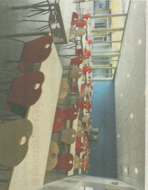
Le restaurant scolaire.