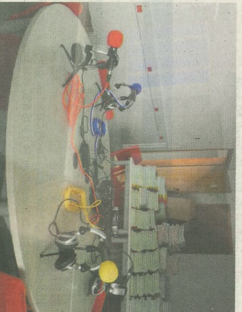
Le studio web.