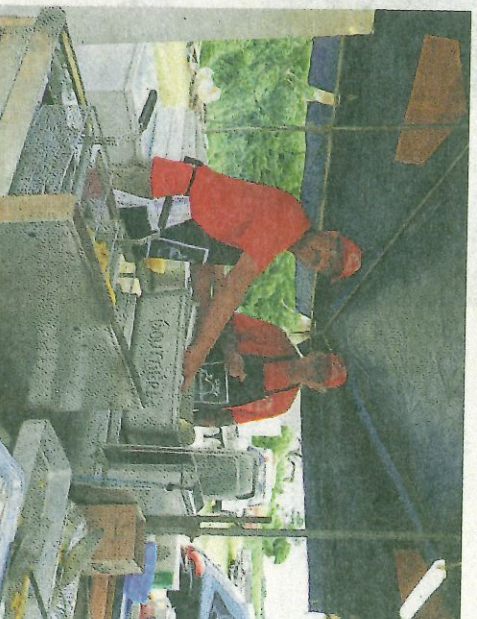
Toute une équipe était mobilisée pour assurer la restauration et l'ambiance.