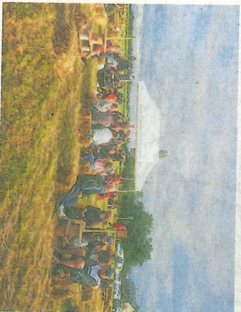
Confiant dans la météo, chacun profite pleinement de sa soirée.

Les organisateurs de leur côté ont remercié tous les spectateurs d'avoir joué le jeu et respecté les règles imposées. La commune renouvelant aussi ses remerciements à tous les bénévoles qui ont répondu présent et au service technique de Mesnil-en-Ouche pour leur soutien.